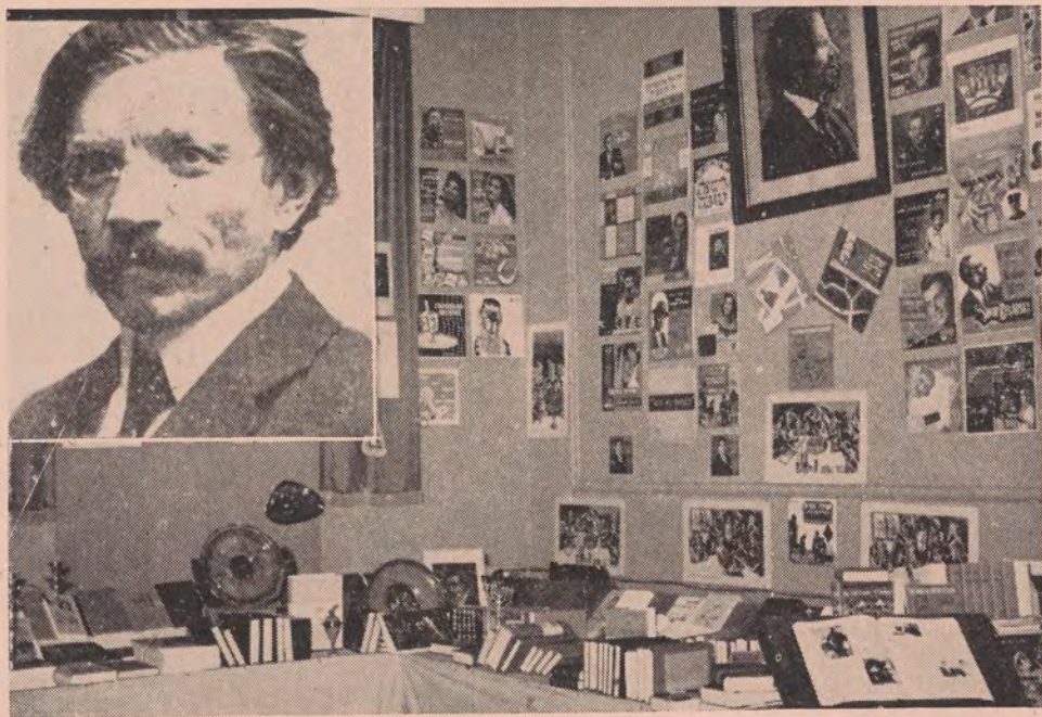
שלום-עליכם-אויסשטעלונג אין „קדימה“